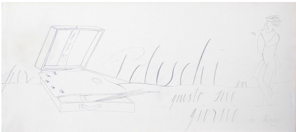
Tela che Valerio Adami ha dedicato a Vittorio Poleschi il giorno di inaugurazione della mostra del '93 a Lucca

La stesura di questo progetto nasce circa un anno e mezzo fa, quando Andrea Poleschi ritrova nei depositi del padre Vittorio, una tela che Valerio dedicò a quest'ultimo in occasione dell'inaugurazione della mostra di Lucca l'8 maggio del '93.