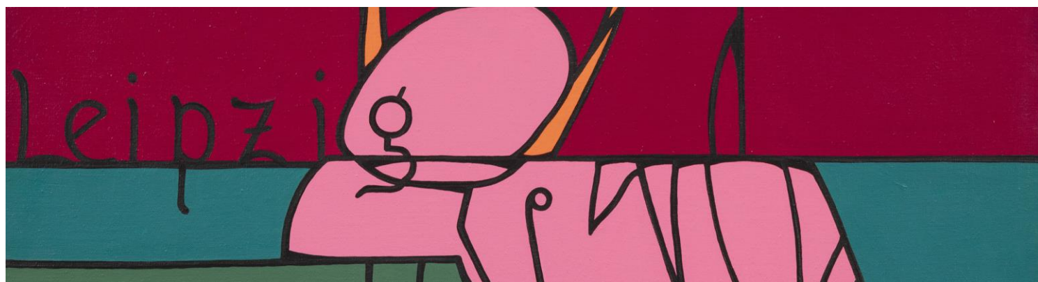
Particolare di: Studio per L'università di Lipsia al tempo di Nietzsche , 1972, olio su tela, cm. 100 x 81

La mostra accompagnata da un catalogo curato da Luciano Caprile, si inaugurerà lunedì 6 giugno 2022, in concomitanza della Design Week milanese, presso la sede di Milano, via Sant’Agnese 18, e sarà visitabile fino al 22 luglio.