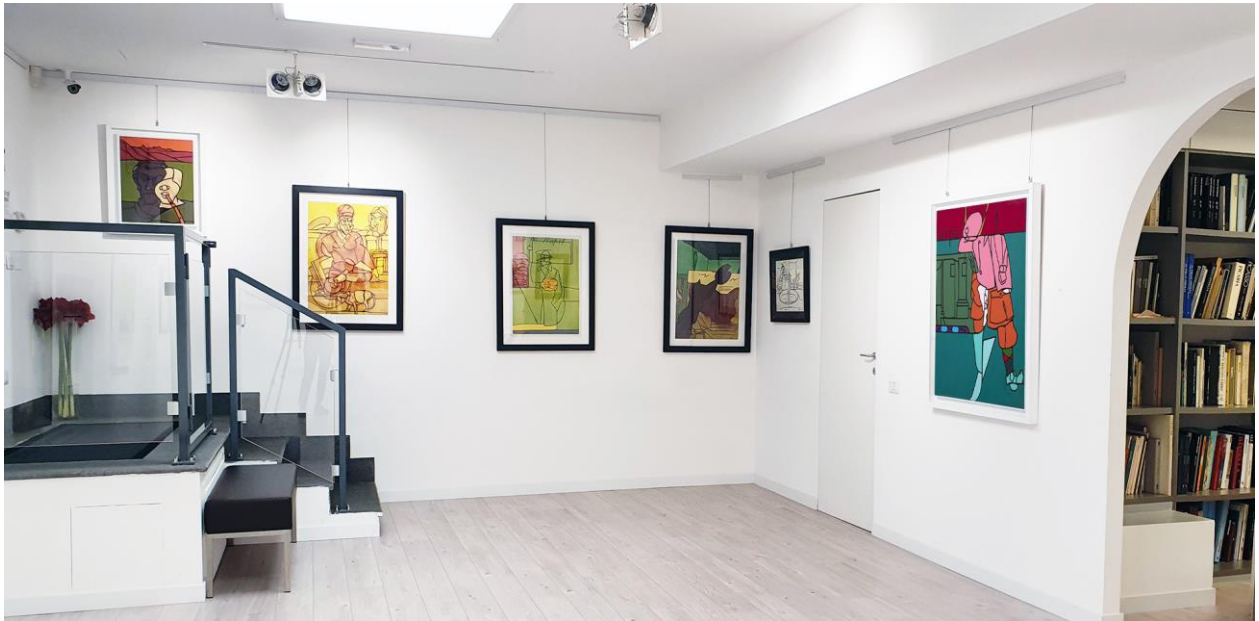
Ambrosiana Art Gallery - 2022