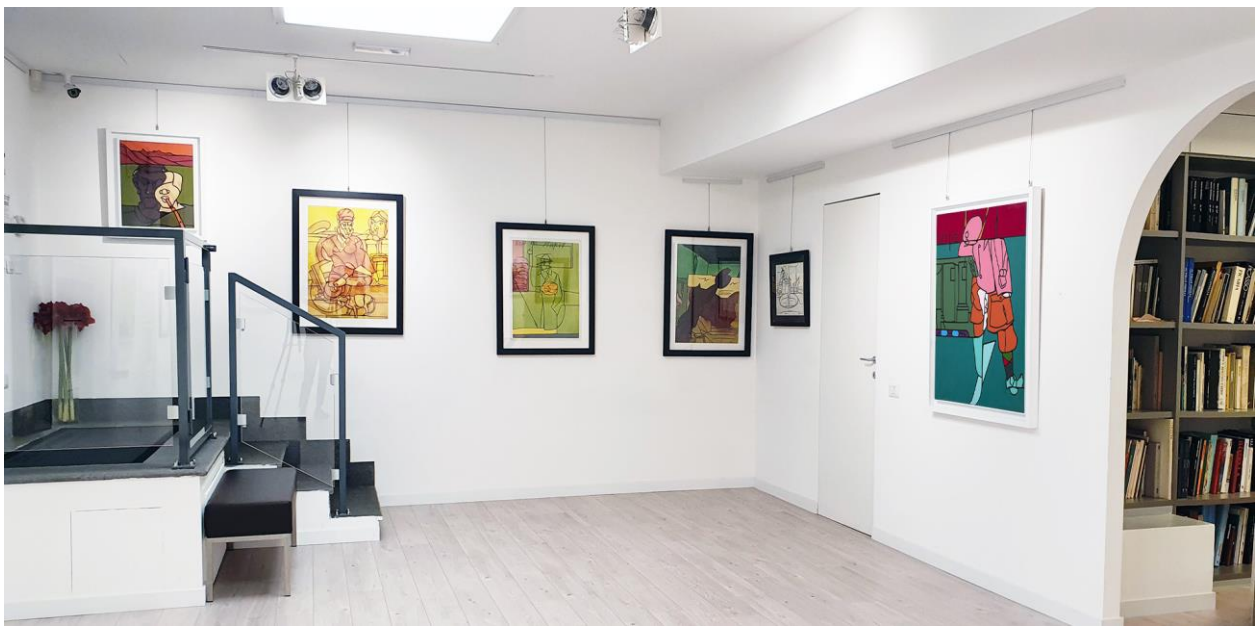
Ambrosiana Art Gallery - 2022