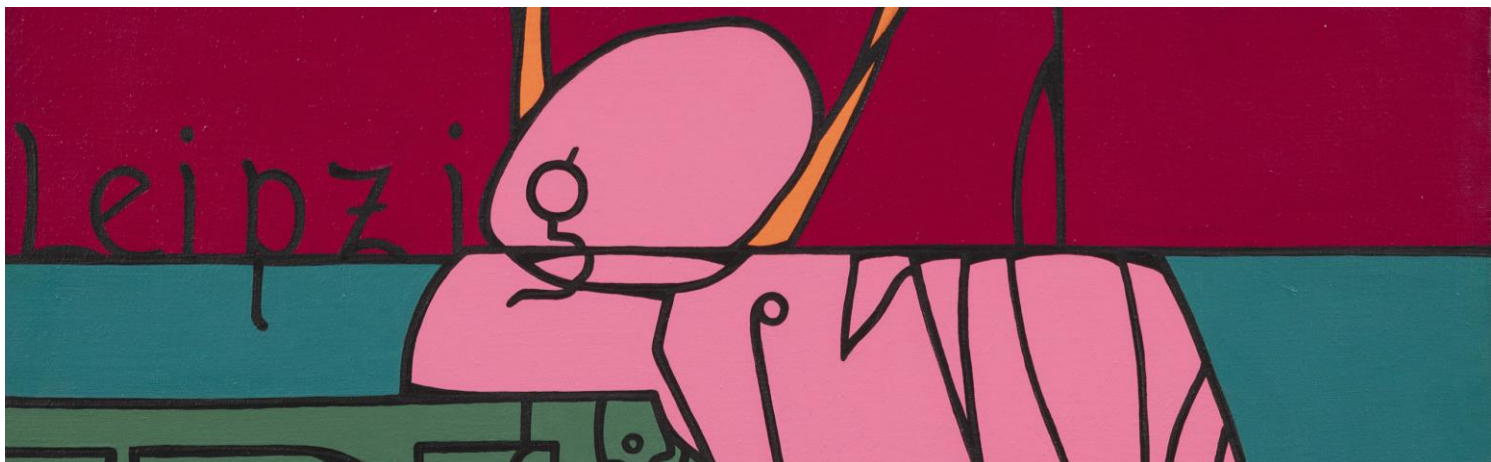
Detail of: Studio per L'università di Lipsia al tempo di Nietzsche, 1972 , oil on canvas, cm 100x80

The exhibition, supported by a catalogue curated by Luciano Caprile, will open on Monday, 6 th June 2022, in conjunction with the Milan Design Week, at the headquarters in Milan, via Sant'Agnese 18, and it will be open until 22 nd July 2022.